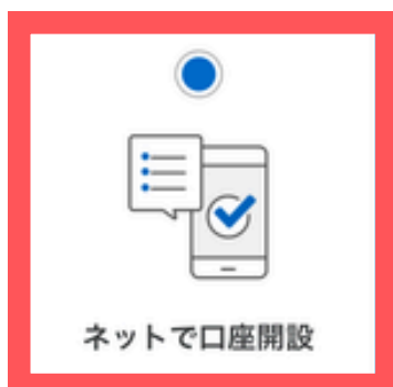
ネットで口座開設

※外国籍のお客さまは「外国籍の方はこちらにチェックをつけてください。」にチェックをしたうえで、「郵送で口座開設」のご選択をお願いいたします。